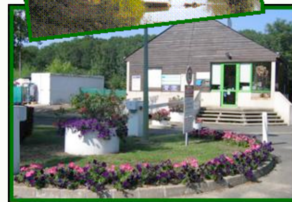
Vous souhaite la bienvenue et un agréable séjour