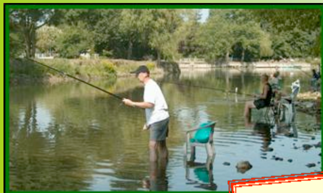
Sa pêche en rivière dans le calme et le repos

Son restaurant, ses jeux, son tennis, son mini-golf, sa piscine