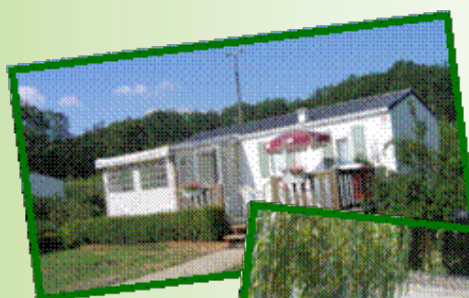
Ses mobile homes